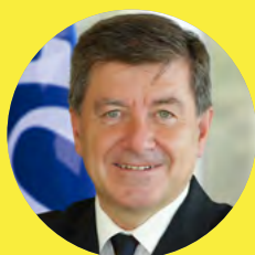
GUY RYDER Director General de la OIT

“En la OIT, la Iniciativa mundial sobre empleos decentes para los jóvenes es nuestra vía para lograr un cambio transformador, trabajando con y por los jóvenes para cumplir con nuestro compromiso compartido con la Agenda 2030 para el Desarrollo Sostenible. Con la participación de más de 80 organizaciones asociadas, estamos dando forma a un futuro del trabajo para los jóvenes centrado en las personas.”