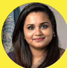
JAYATHMA WICKRAMANAYAKE Enviada del SG de la ONU para la Juventud

“Una de las cinco prioridades de la Estrategia de Naciones Unidas para la Juventud (Juventud 2030) es el: “Empoderamiento económico por medio del trabajo decente - Apoyar un mayor acceso de los jóvenes al trabajo decente y al empleo productivo”. Este es precisamente el propósito y el mandato de la Iniciativa Global sobre Empleo Decente para los Jóvenes, y nos complace que la Iniciativa sea un ejecutor oficial de la Estrategia”